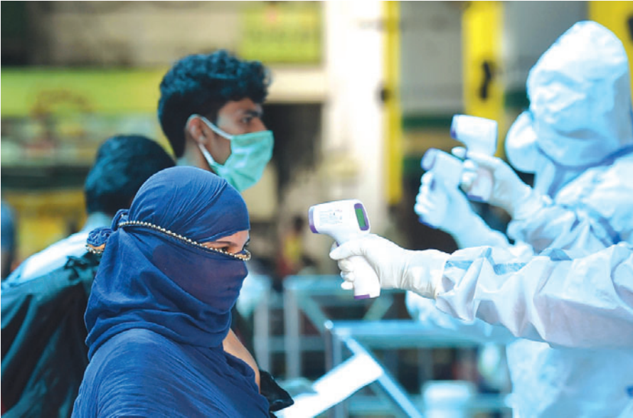
कोलकाता के हावड़ा स्टेशन पहुंचने वाले प्रवासियों की थर्मल स्क्रीनिंग से जांच

अमेरिका, ब्राजील, रूस, ब्रिटेन, स्पेन और इटली के बाद कोविड-19 महामारी से सबसे ज्यादा प्रभावित होने वाले देशों में भारत सातवें पायदान पर है। देश में कोरोनावायरस के सक्रिय मामलों की तादाद 1,06,737 है। स्वास्थ्य मंत्रालय के आंकड़ों के अनुसार, कोरोनावायरस से संक्रमित मरीजों में से लगभग आधे यानी 1,04,106 में सुधार देखा जा रहा है। स्वास्थ्य मंत्रालय के एक बयान के मुताबिक, ‘पिछले 24 घंटों के दौरान कोविड-19 के 3,804 मरीज ठीक हो गए हैं।’ संक्रमण के मामले बढ़ने की वजह से रिकवरी की दर में कमी आई है और यह 48 फीसदी के मुकाबले घटकर 47.99 फीसदी रह गई है। महाराष्ट्र में संक्रमण के सबसे ज्यादा 74,860