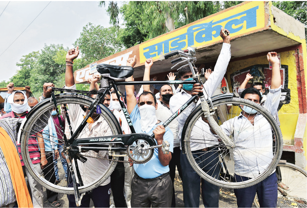
Workers stage protest outside Atlas Cycles' factory in Ghaziabad on Thursday after the company shut operations because of financial constraints. The company has sacked 700 employees, according to media reports